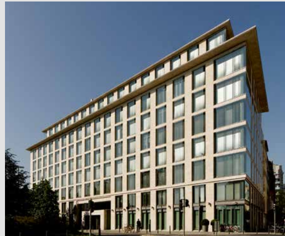
Metzler-Hauptgeschäftssitz Untermainanlage 1, Frankfurt am Main